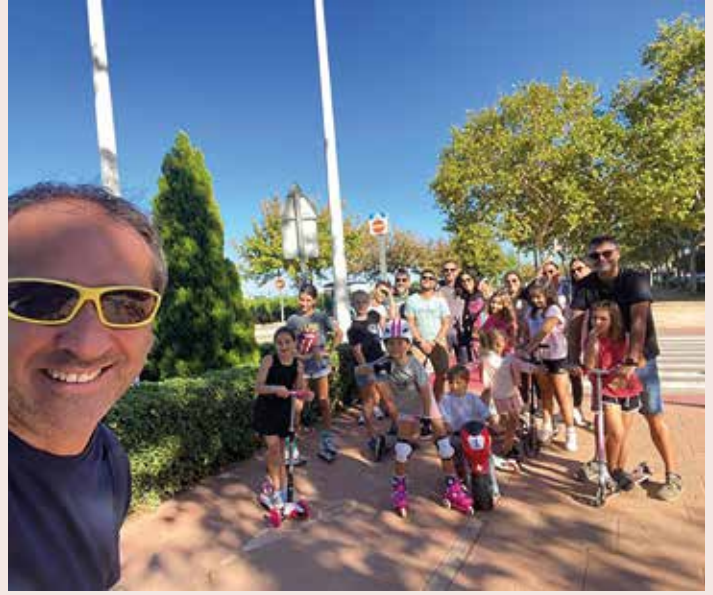
Passeig amb rodes Setmana de la mobilitat sostenible