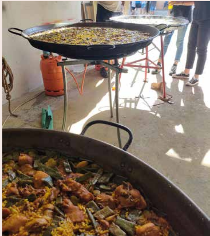
Dinar germanor i-e Dinar germanor falles i+e de València.