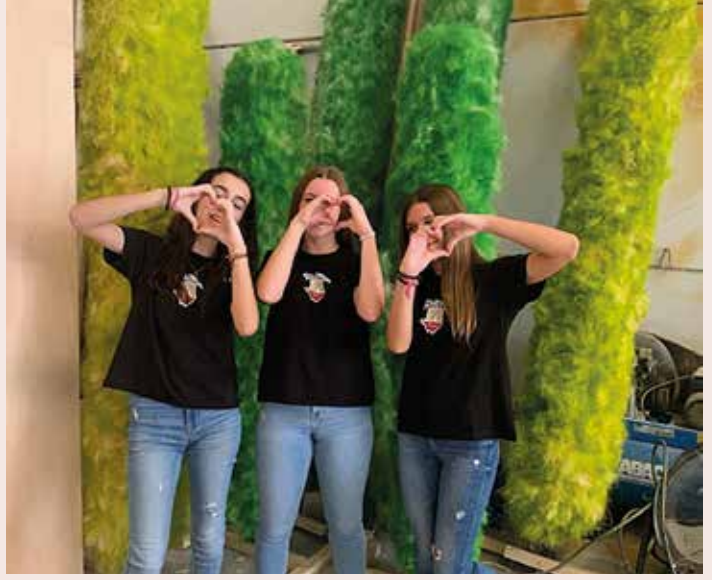
Visita taller falla sostenible Visita al taller de la falla gran, falla feta amb materials sostenibles.