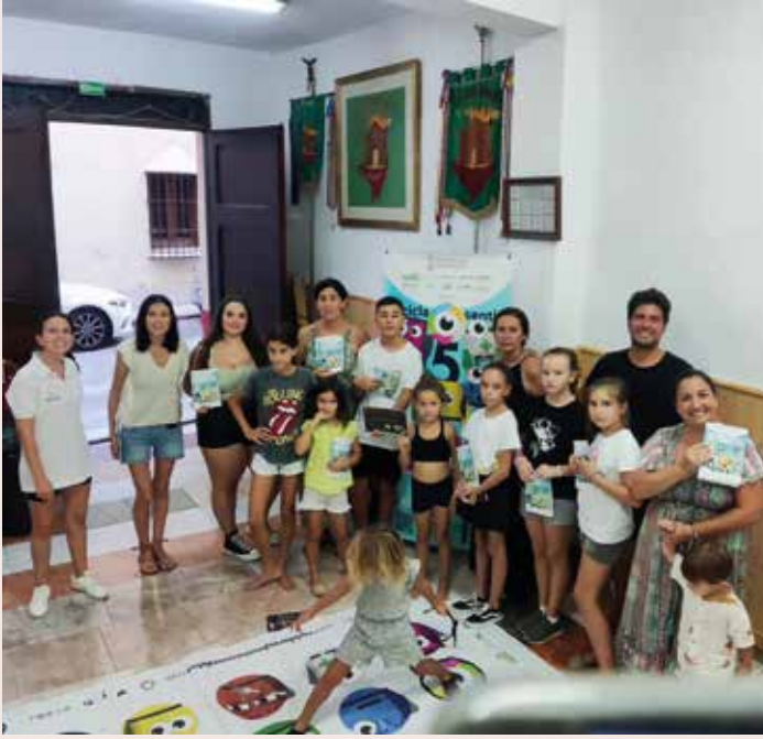
Planeta R5S. Taller recicla amb els cinc sentits Conscienciem de la importància del reciclatge entre els més menuts.