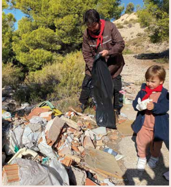
Ruta i repte: Senda dels Lladres Coneixem el nostre entorn mitjançant reptes relacionats amb els ODS.