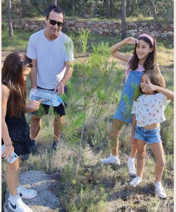
Replantació d'arbres Seguiment de la plantació que va realitzar la nostra xicalla l'any passat.