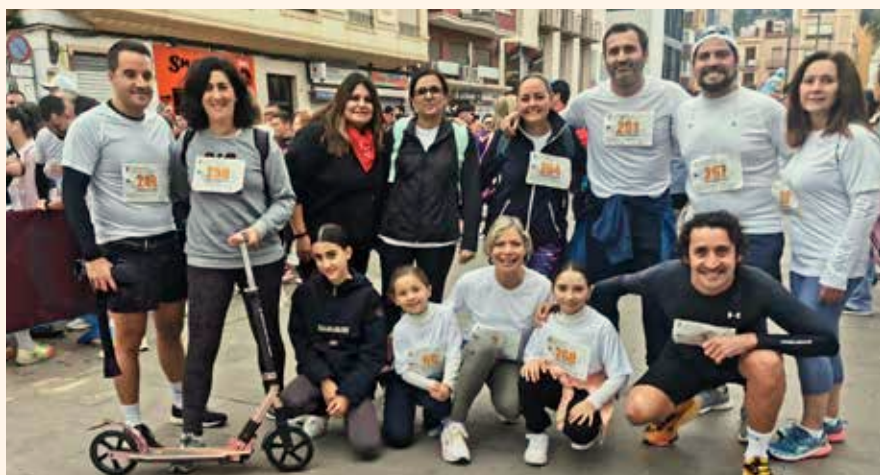
Participació en la I Carrera Popular Fallera inclusiva i solidària a favor d'associacions comarcals i municipals afectats per la DANA. →↑