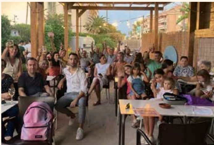
#Stem de birres a l'estiu. Micropo- nències al voltant de les Festes del Foc. →