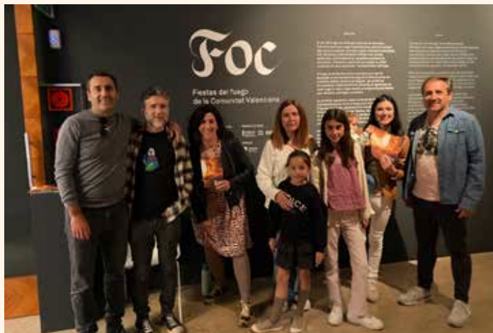
Visita a l'exposició Foc – Festivitats del foc en la Comunitat Valenciana al Centre Cultural del Carme. ←↑