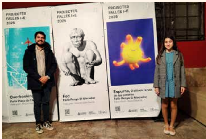
Presentació dels projectes FOC i ESPURNA junt la Federació de Falles I+E celebrat al Centre Cultural del Carmen a València. ←↑