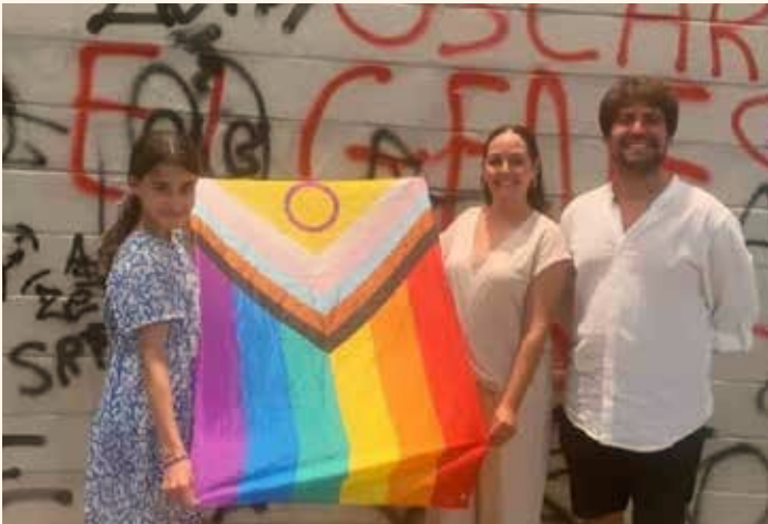
Assistència al I Col·loqui LGTBIQ+ al món faller. ←