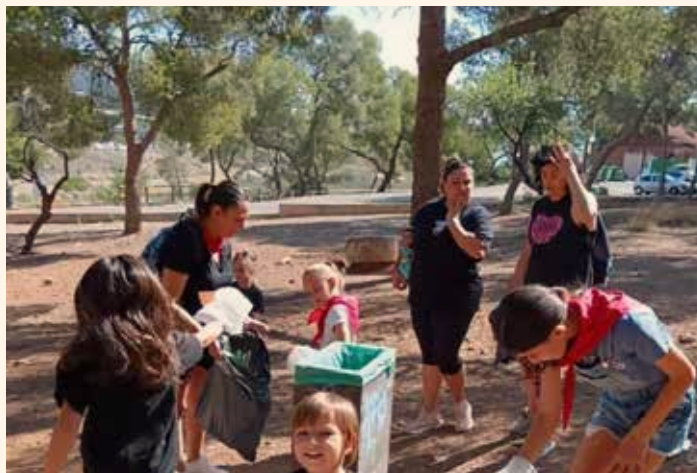
Muntanya i foc. ←↑