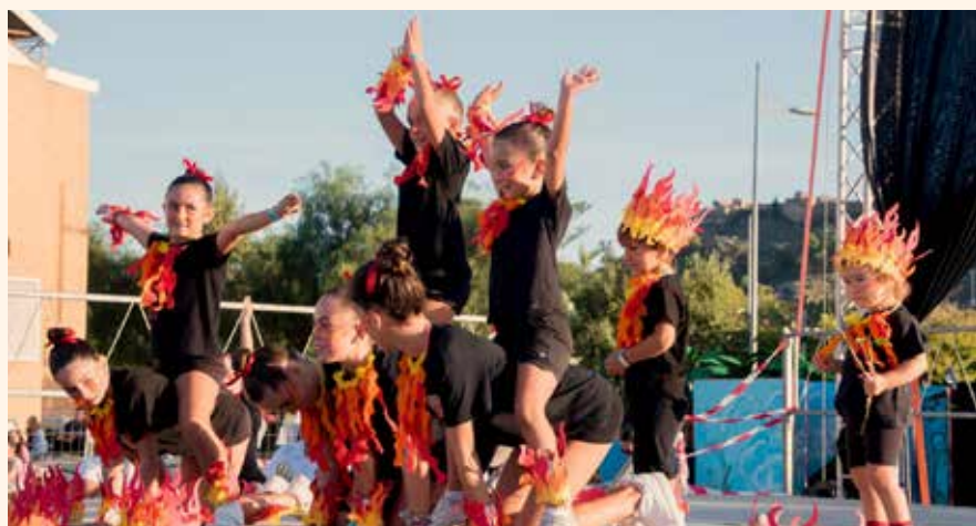
La xicalla interpreta el playback FOC. →↑