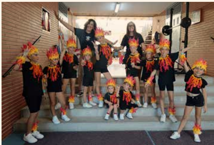
La xicalla interpreta el playback FOC. ←↑