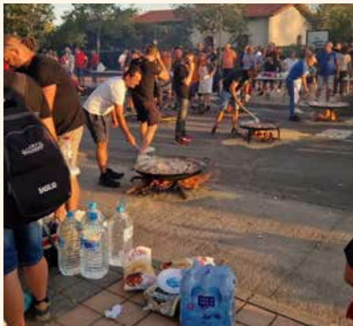
Concurs de paelles organitzat per FJFS. ↑↓