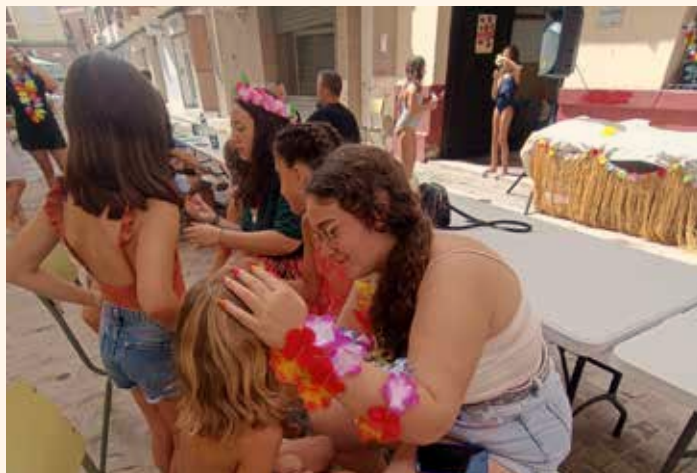
FOC: Festa d'Oci i Cultura. ←↑