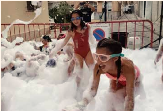
FOC: Festa d'Oci i Cultura. ←↑