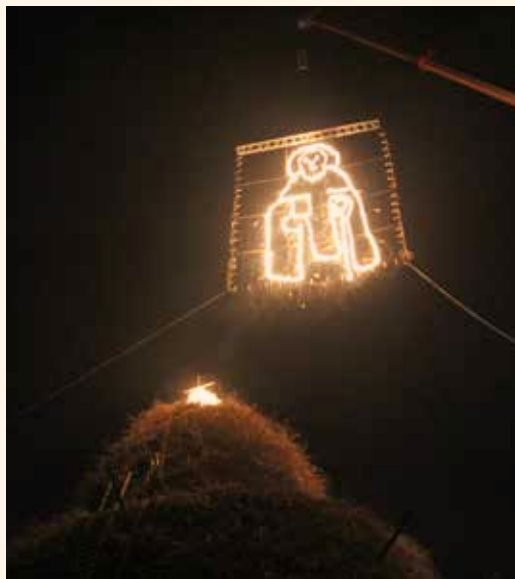
Xarxa Teatre. Cremà de la Focara de Novoli. ←

Sarments o branques de pins, siluetes més estilitzades o barraques amb un refugi interior per poder-te protegir del foc, teatralitzacions i devoció, risc i alegria... les santantonades de la Mediterrània son la festa d'hivern per excel·lència. Canals o els pobles interiors de Castelló estan ben a prop de les festes a Sant Antoni del Sud d'Itàlia. En definitiva el Mediterrani sempre ha estat un pont de mar blava. Un honor haver pogut participar activament en la crema de la Focara de Nòvoli.