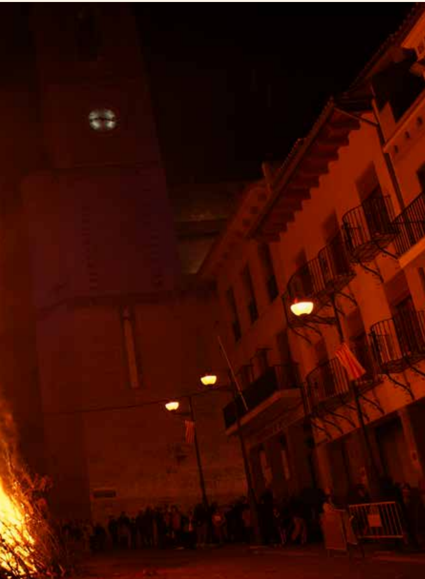
Foguera a Sagunt.