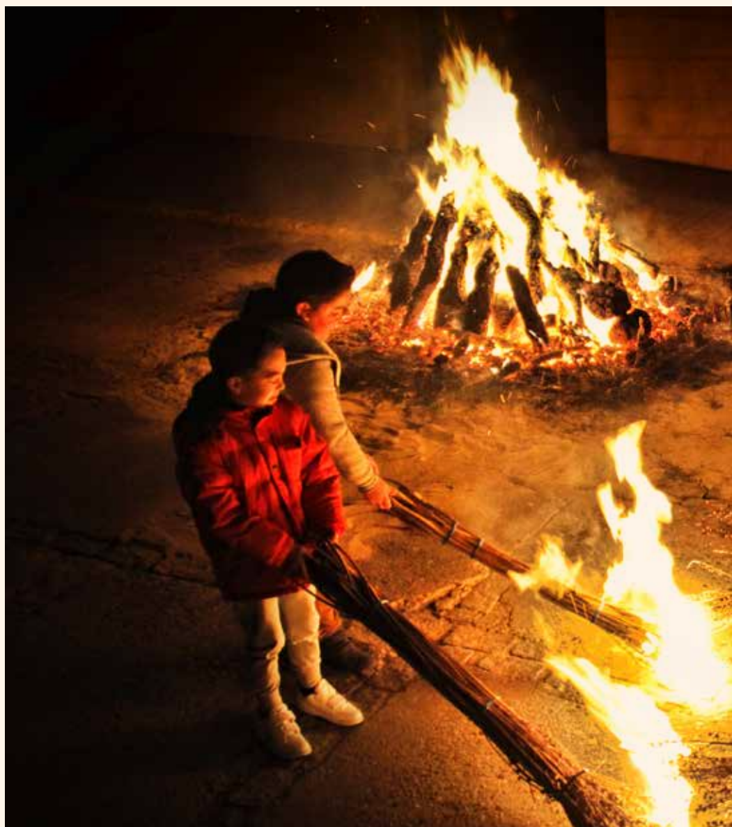
Candela del Carrer Hort. Imatge de José Manuel Vázquez Lazo. →