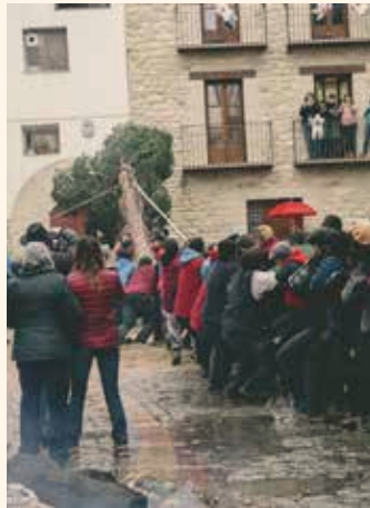
Amunt el Maio.