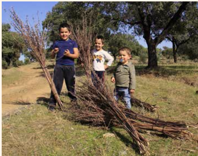
Xiquets recol·lectant la gamonita per a fer les destrals. ←

El culte, molt popular ja al segle XII, no trobava una solució teològica final al XIII. Fins i tot la Seu Apostòlica Romana no secundava aquesta festivitat, per considerar-la com un assumpte merament popular.