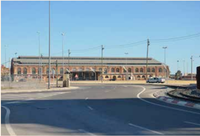
Nau de tallers.