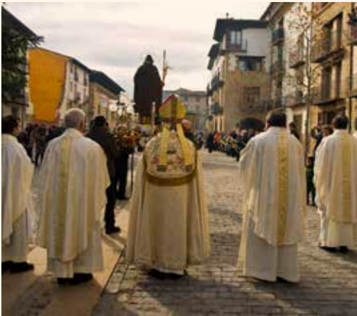
Processó de Sant Antoni Abat.