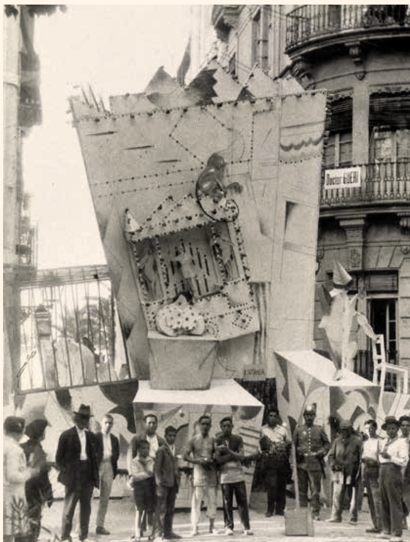
1929. Foguera Plaza d'Isabel II «Barraca de Fira» (Imatge de Lorenzo Aguirre).