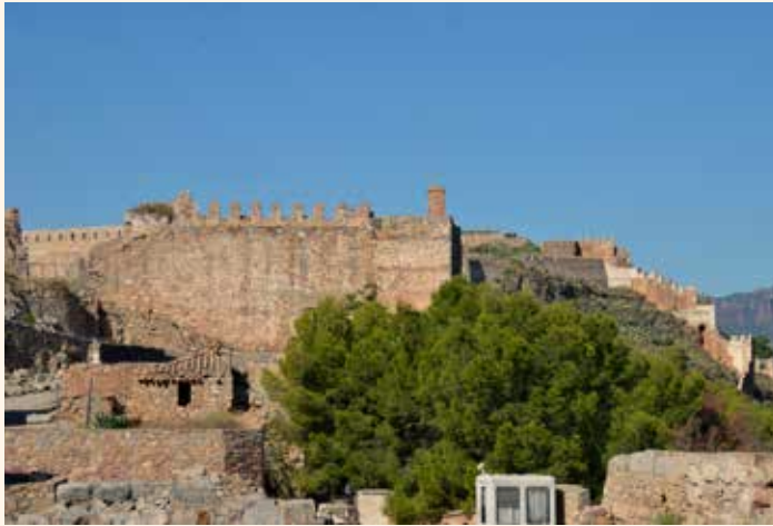
Castell de Sagunt.