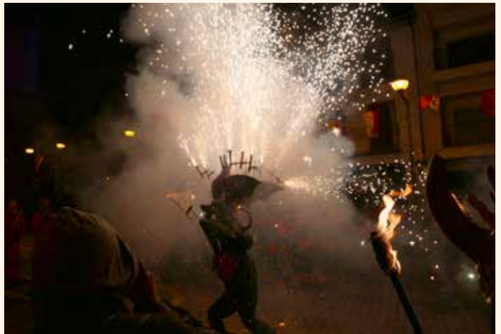
El foc de Sant Antoni a Sagunt. →