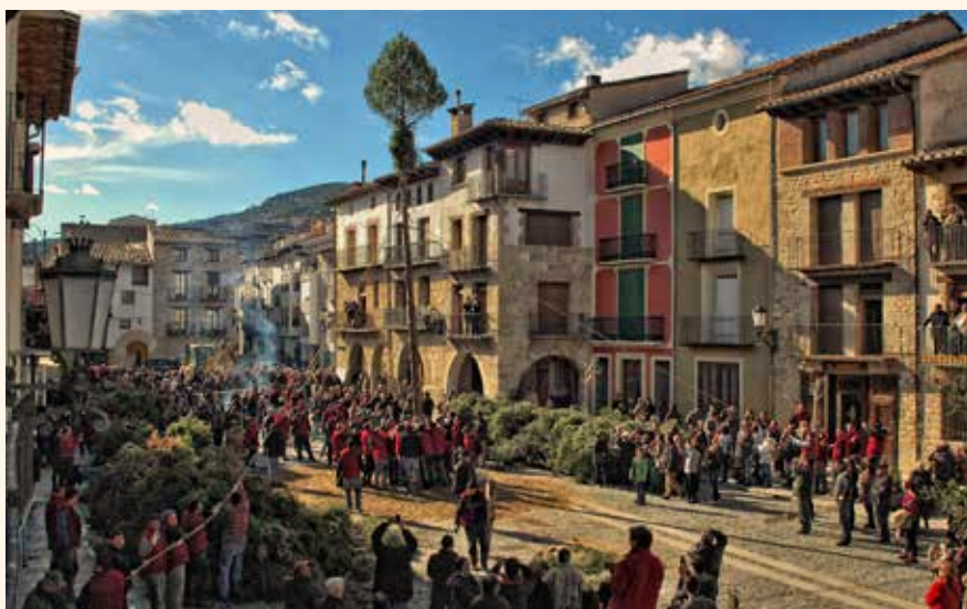
Plantada del Maio. Imatge d'Adela Ramírez. ←

Ja divendres al matí alguns protagonistes matinen de valent. Alguns membres de la santantonà (grup de gent que col·labora per fer algunes tasques de la festa) passegen l'esquellot, gran esquella que produeix un so greu i característic. Instants més tard els gaiters, nom que a la comarca dels Ports reben els dolçainers, i els tabalers ixen a tocar la despertada o diana. Ambdós grups pels carrers que consuetudinàriament veuran totes les desfilades de la festa. Durant tot el matí es busca la llenya tallada una setmana abans i s'ultimen els preparatius per al moment més intens i esperat, a la plaça hi ha una barreja de nervis, inquietuds i emocions. Quan toca la una de la vesprada al vell rellotge de la façana de l'Ajuntament, els xiquets i les xiquetes de l'escola s'agafen a la corda amb tota l'energia possible