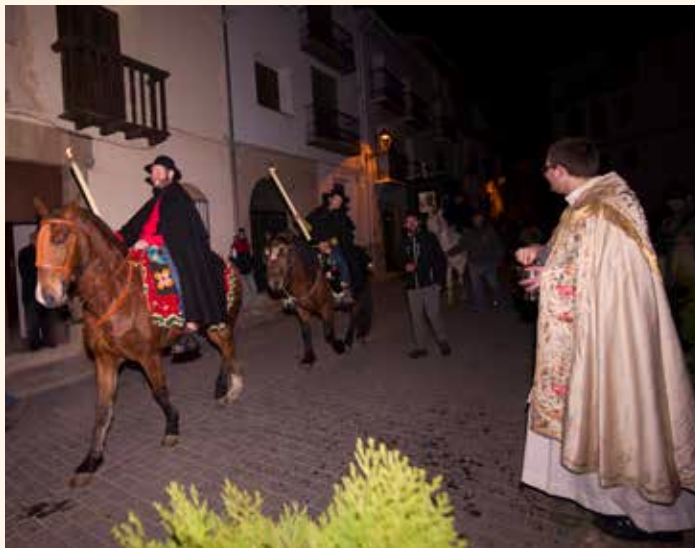
Processó dels Matxos i Benedicció dels animals. ←

El cap de setmana festívol s'inicia amb l'encesa de les tronques amb els primers instants del divendres i que es mantenen enceses fins les darreres hores de diumenge. Les tronques són grans troncs o arrels de carrasca, ametller o algun arbre de ribera que arrossega el riu. Durant tot el cap de setmana són lloc de reunió per parlar, escalfar-se del fred intens del gener i rostir algun producte de la matança.