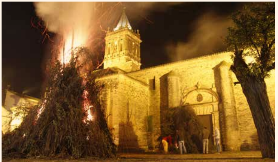
Candela el Paseo Redondo.