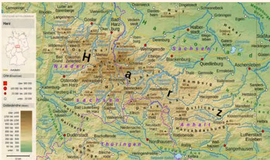
Mapa topogràfic dels monts Harz.