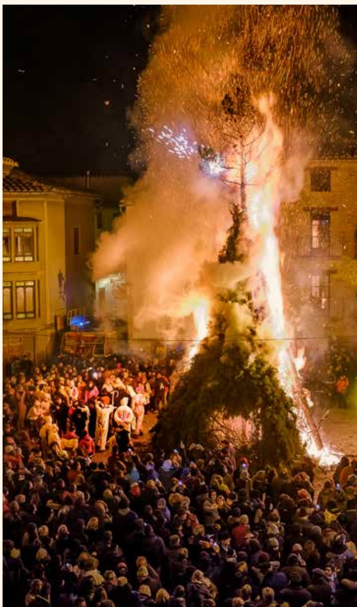
Barraca en flames després de la Santantonà. →