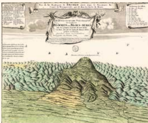
L.S. Bestehorn, 1732, Perspectiva des de on es pot veure des de la persona que està en peu en la cima de la muntanya. Publicat per Homann. Hereus. 1749.