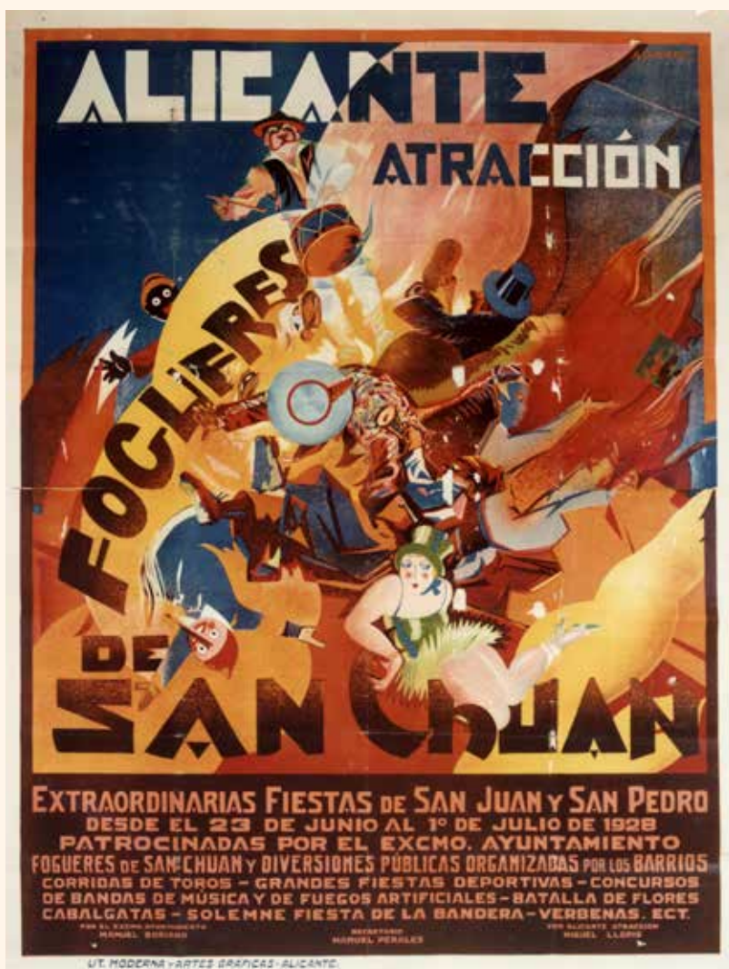
1928. Cartell de l'edició fundacional dels Fogueres, obra de Lorenzo Aguirre.