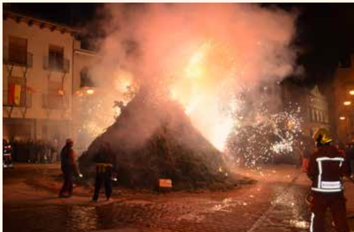
Foguera de Sant Antoni. Sagunt. ←