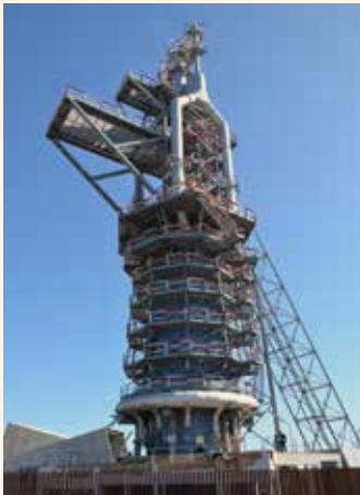
Alt forn. Seria una llàstima perdre tot açò pel foc de la depredació.