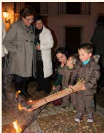
Xiquets cremant les seues hacas en la candela de l'església de La nostra Senyora de l'Asunción.