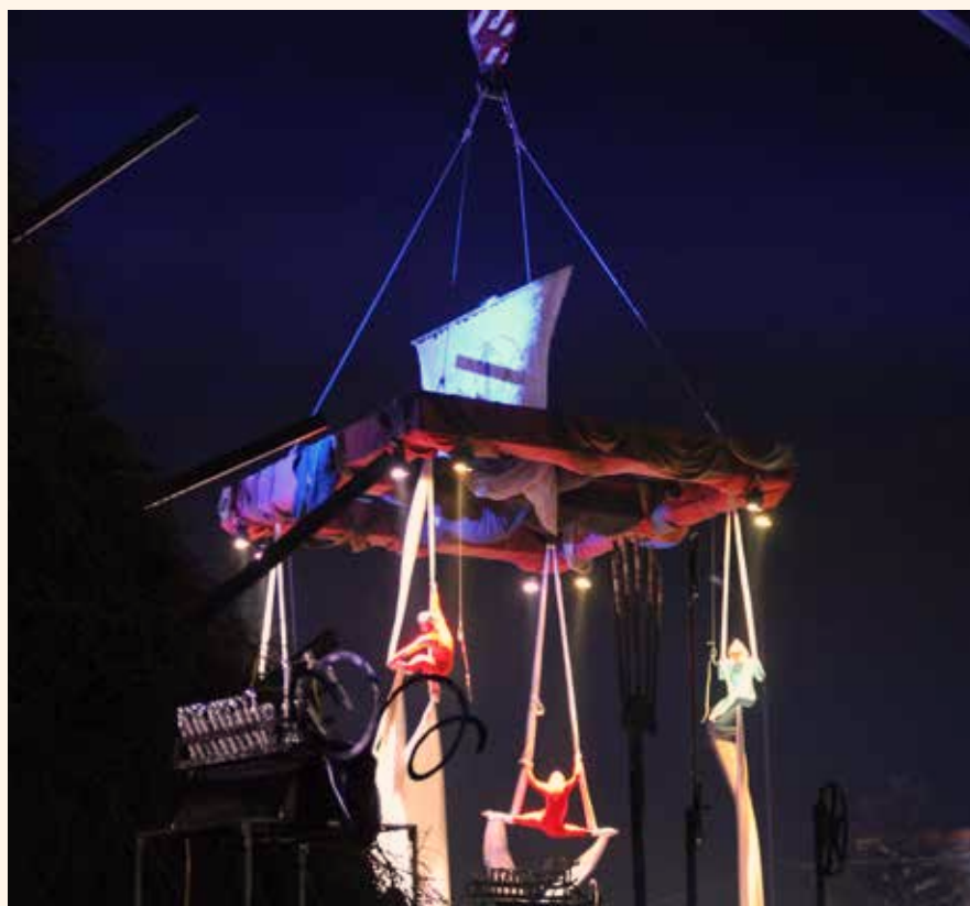
Xarxa Teatre. Cremà de la Focara de Novoli.