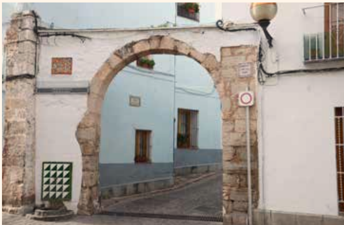
Porta de la Jueria.