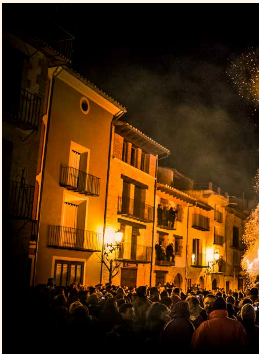
Foc a la Barraca.